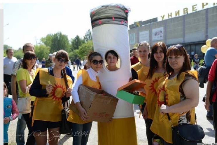
Акция «Мы не курим!»