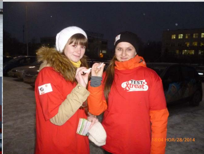
Студенты раздают листовки