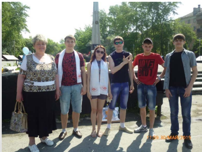
День памяти умерших от ВИЧ