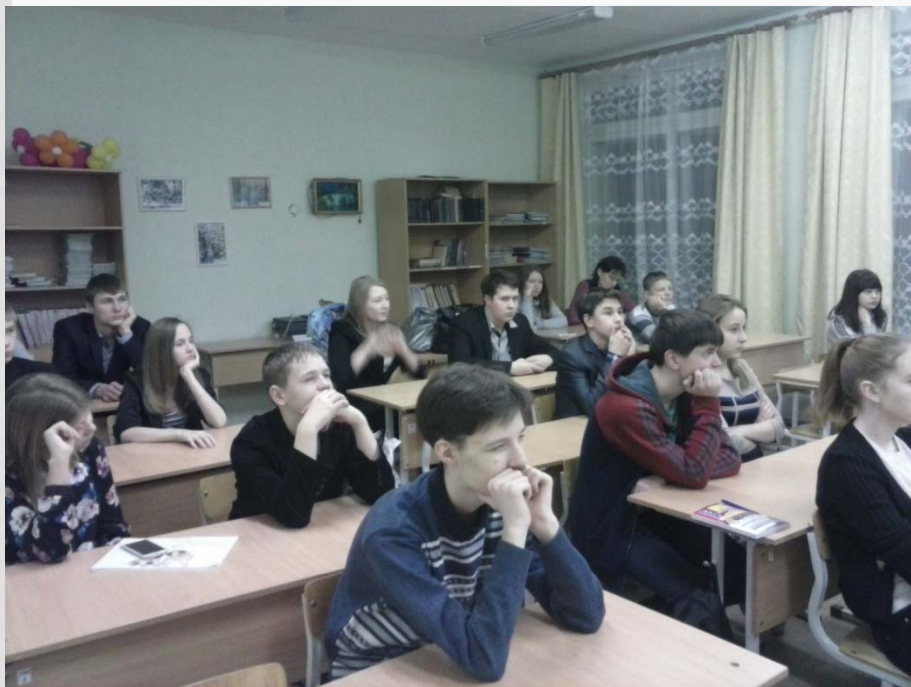
Во время проведения беседы