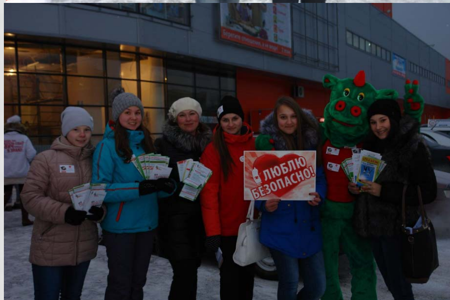
У торгового центра «Небо»