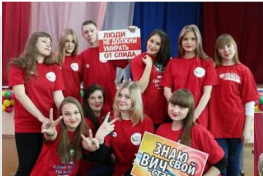
Студенты 1 курса специальности Сестринское дело