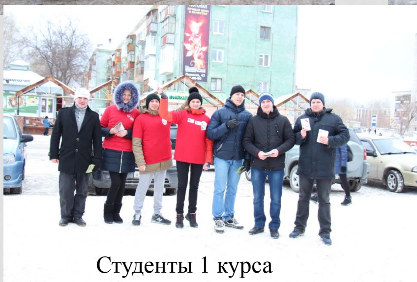
Студенты 1 курса специальности Лечебное дело