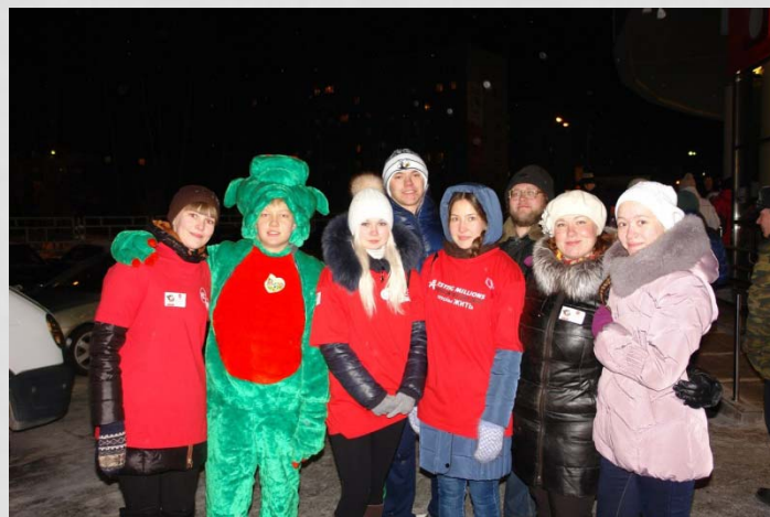
Акция «Я выбираю жизнь!»