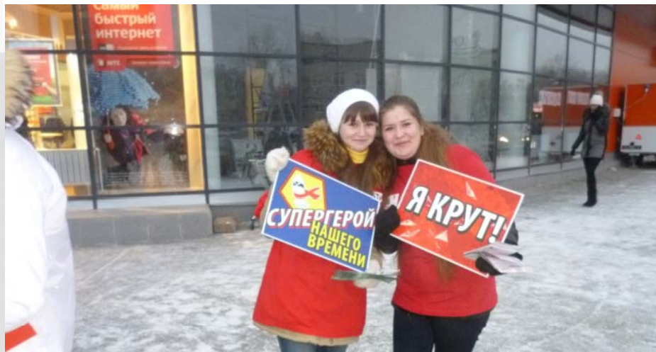
Студенты развешивают плакаты